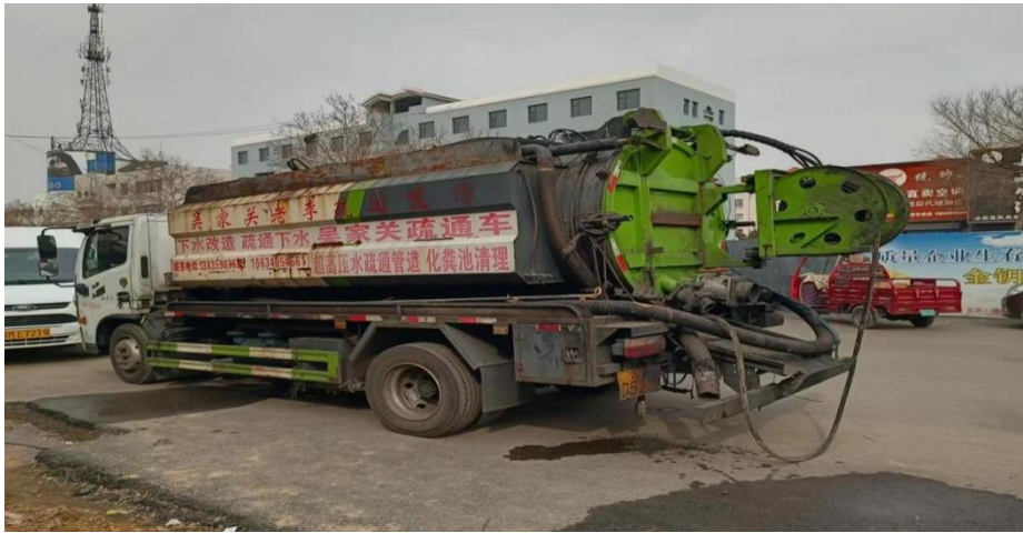
图 7 停放在事故现场的污水疏通车