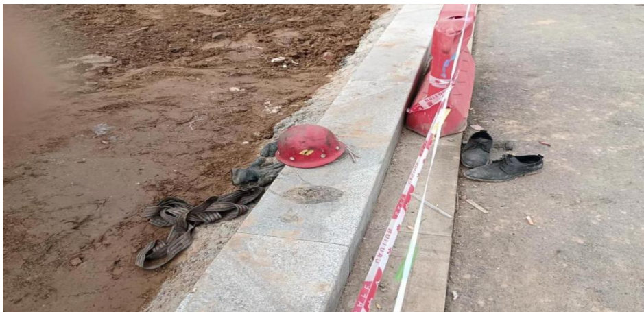
图 6 事故现场遗留的皮鞋、安全帽、尼龙带