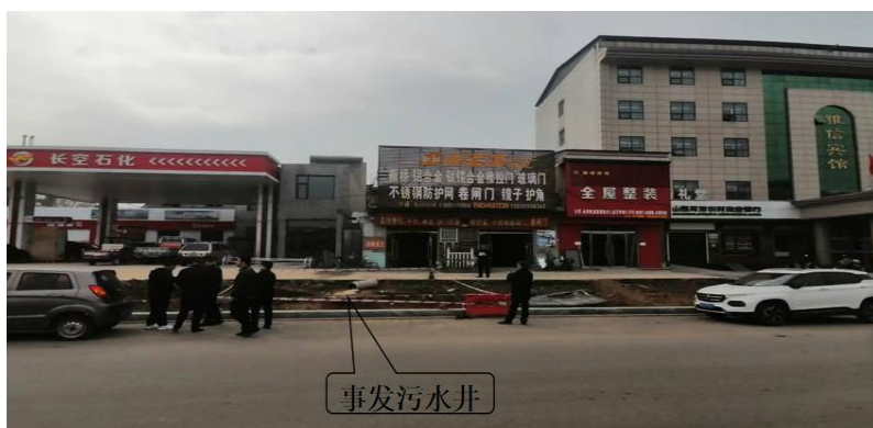
图 2 事发现场相对位置照片