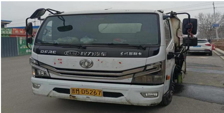
图 8 污水疏通车车型与牌照