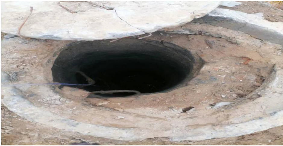
图 4 事发污水检查井现场照片