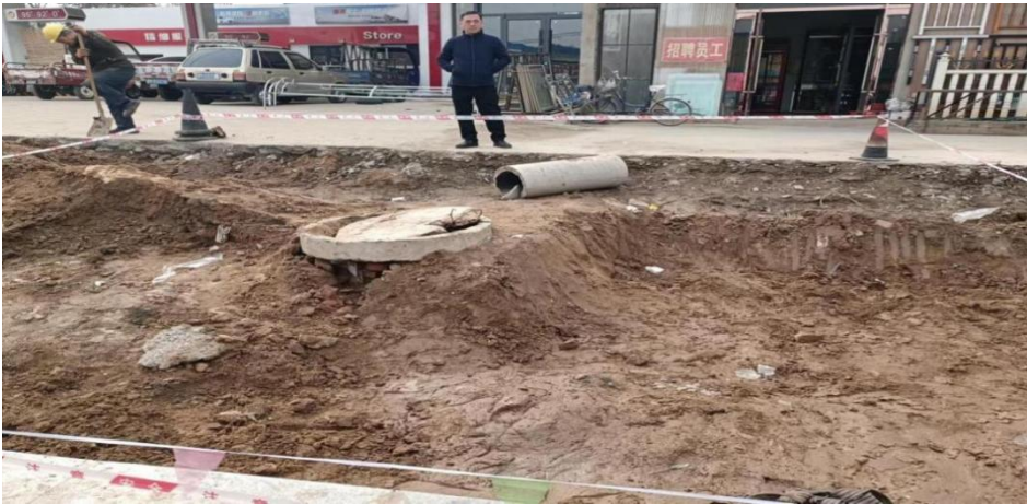
图 5 事故现场警戒范围照片